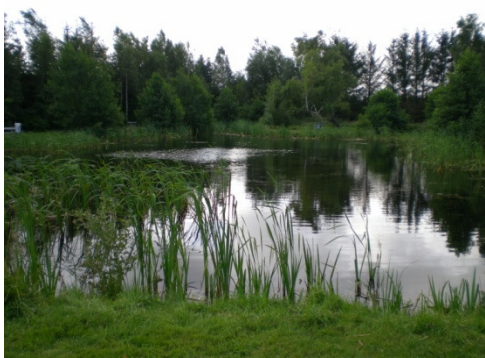
Hytterne skal ligge med udsigt til søen.

Herunder og på næste side præsenteres vores projekt i billeder.