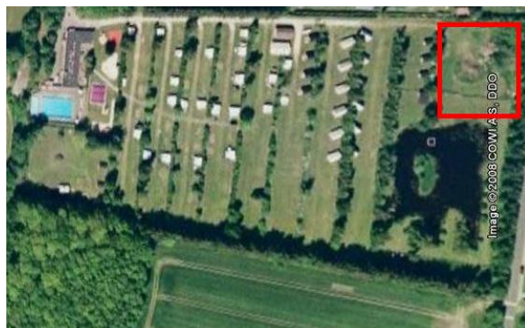
Hytterne skal ligge i det markerede område, der har vi tilladelse til 8 hytter.